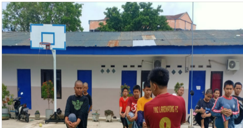
Gambar 2. Sesi Pemanasan