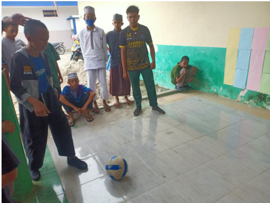
Gambar 12. Mengamati Peningkatan Hasil Belajar Siklus 2