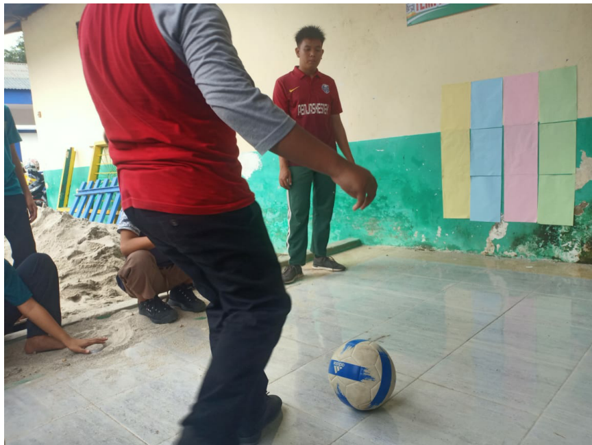
Gambar 7. Mengamati Peningkatan Hasil Belajar Siklus 1