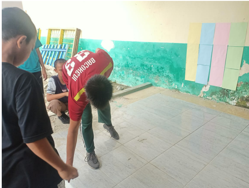
Gambar 4. Menentukan titik jarak tendangan