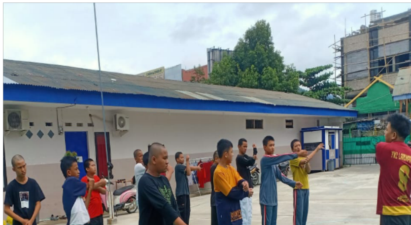
Gambar 3. Sesi Pemanasan