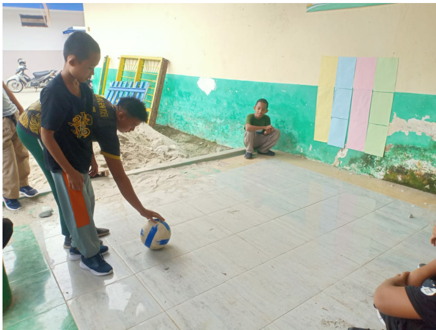
Gambar 11. Mengamati Peningkatan Hasil Belajar Siklus 2