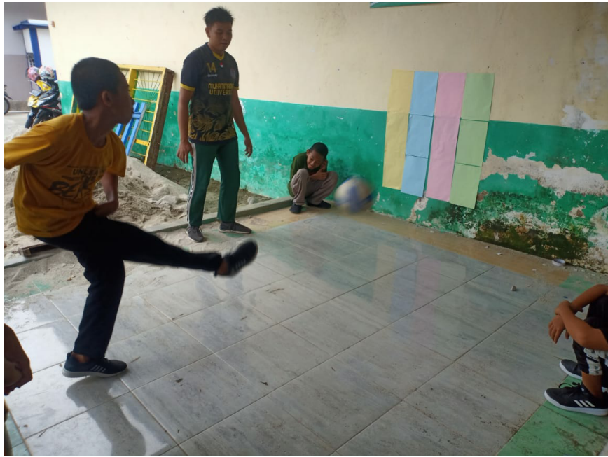
Gambar 10. Mengamati Peningkatan Hasil Belajar Siklus 2