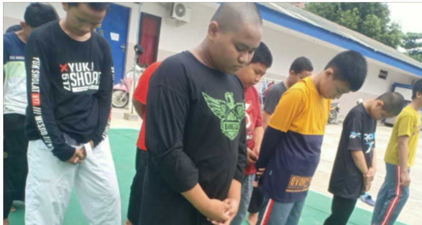
Gambar 1. Berdo'a