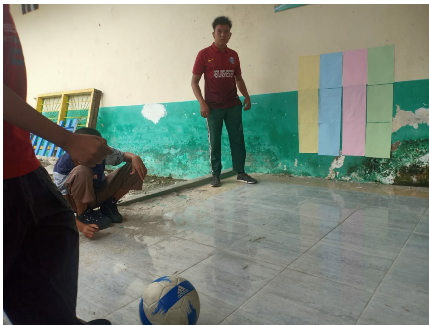
Gambar 5. Mengamati Peningkatan Hasil Belajar Siklus 1