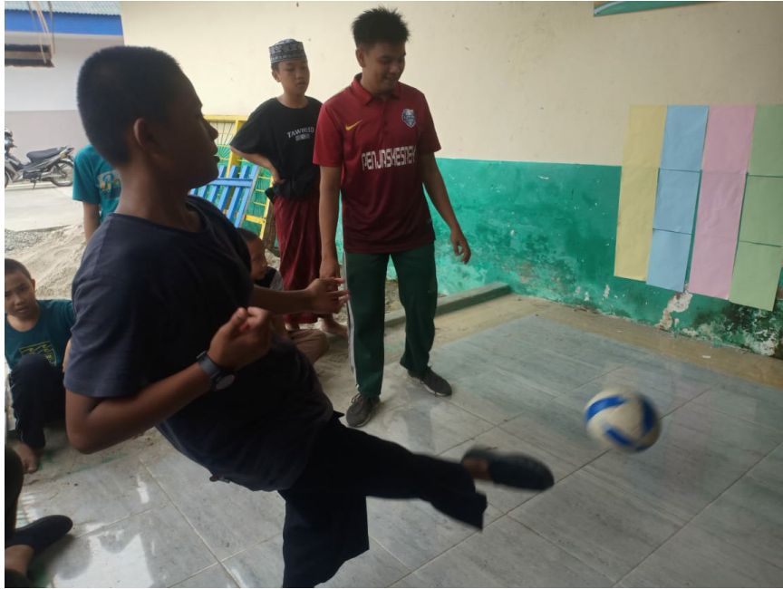
Gambar 6. Mengamati Peningkatan Hasil Belajar Siklus 1