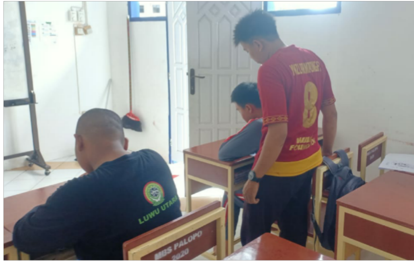
Gambar 8. Pelaksanaan tes Kognitif