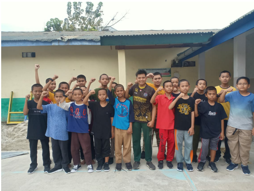
Gambar 13. Photo Bersama Peserta didik