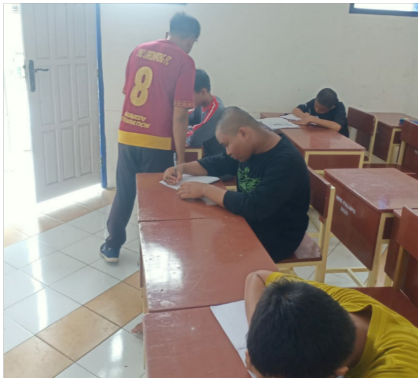
Gambar 9. Mengamati Pelaksanaan tes Kognitif