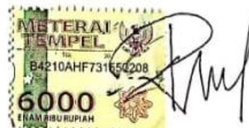
Reski Amalia Putri

Palopo, 24 September 2020 Yang memberi pernyataan