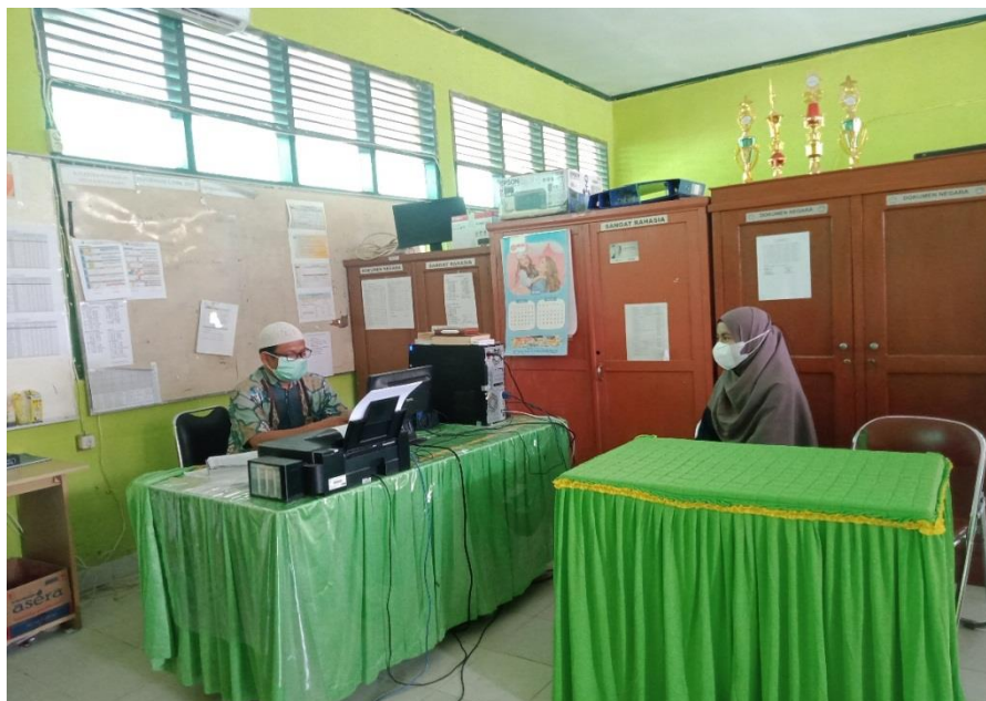
Gambar 5. Pertemuan Dengan Bagian Kurikulum