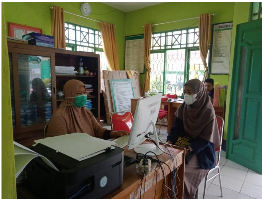
Gambar 3. Pertemuan Dengan Bagian Tata Usaha