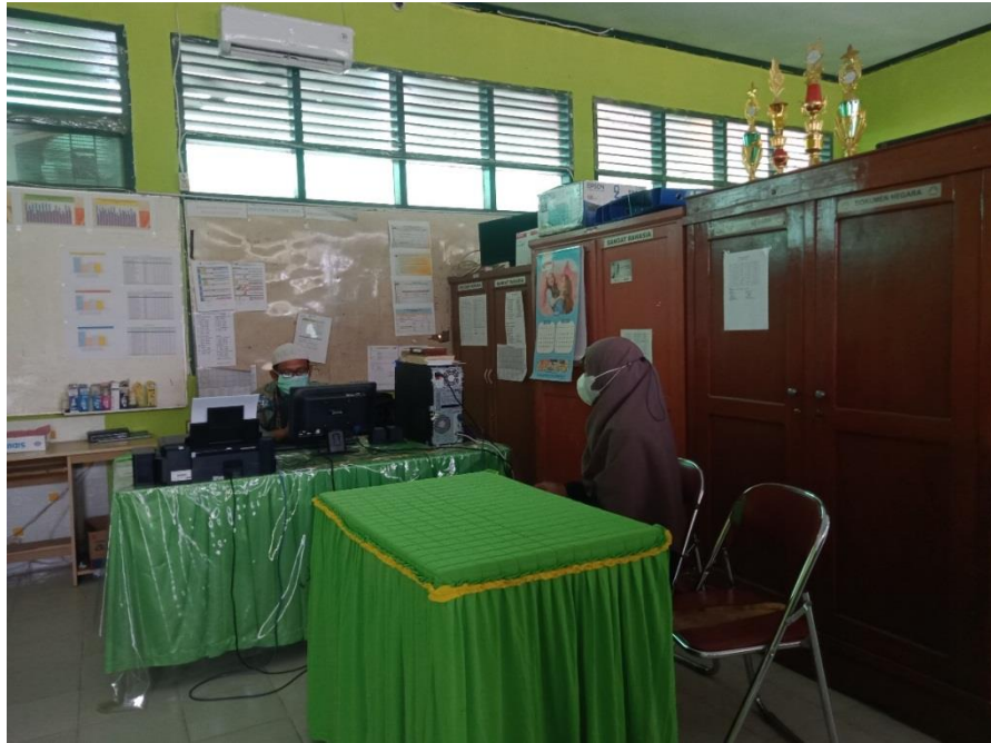
Gambar 4. Pertemuan Dengan Bagian Kurikulum