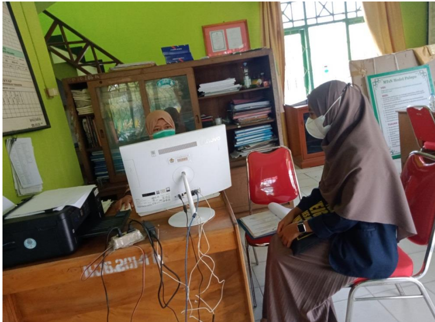
Gambar 2. Pertemuan Dengan Bagian Tata Usaha