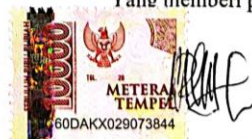
Ain Nur Rofiq S