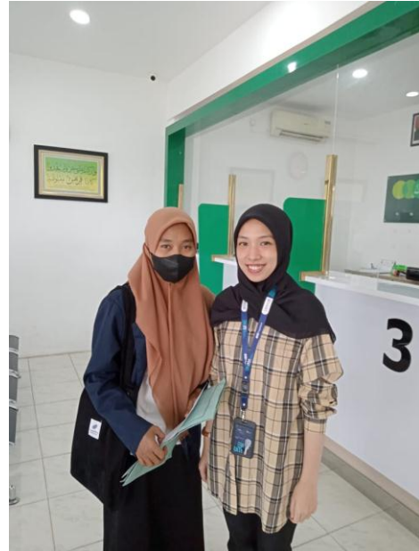
Dokumentasi wawancara di PT Pegadaian Syariah (Persero) Cabang Luwu