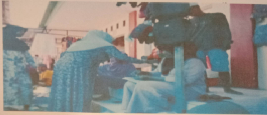
Suasana pengabdian arisan