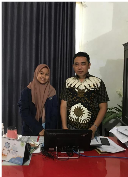
KANTOR INSPEKTORAT KAB LUWU UTARA