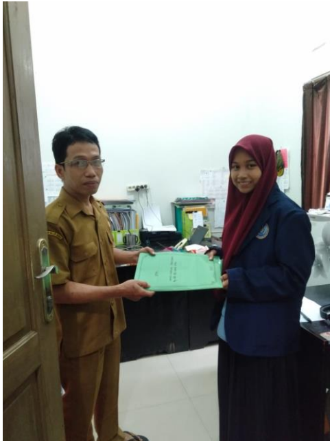
KANTOR INSPEKTORAT KOTA PALOPO