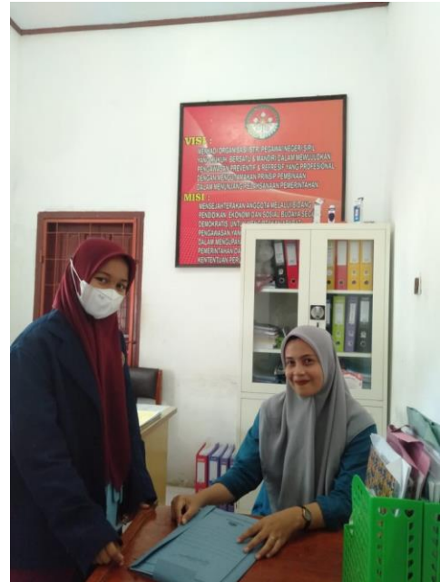
KANTOR INSPEKTORAT KAB.LUWU