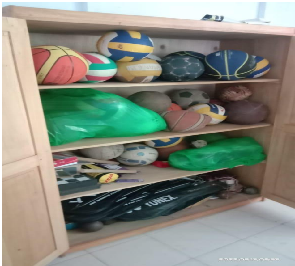
Gambar sarana prasarana (alat dan bahan olahraga)