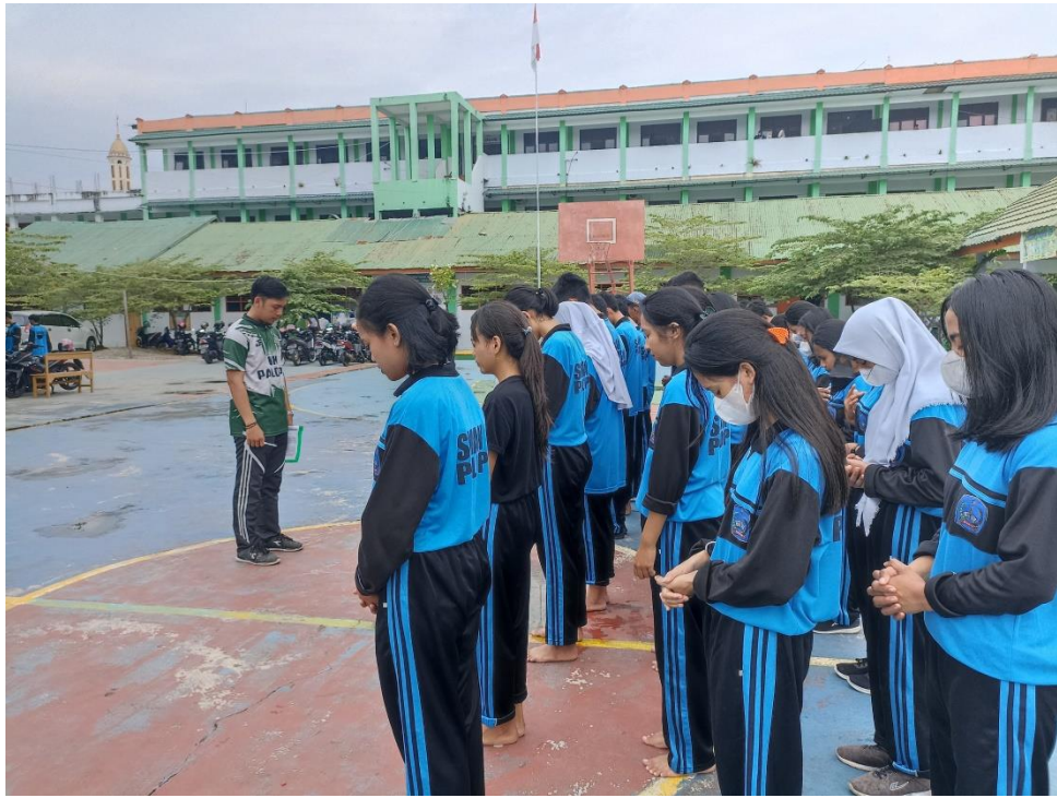
Gambar Pembacaan doa sebelum olahraga