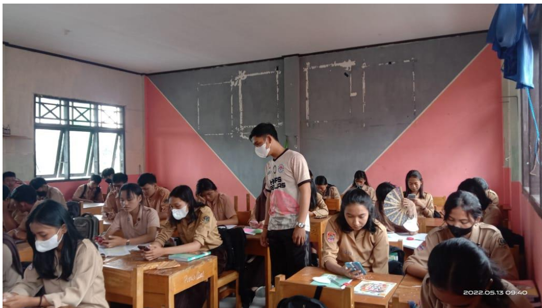
Gambar proses pengisian kuesioner penelitian