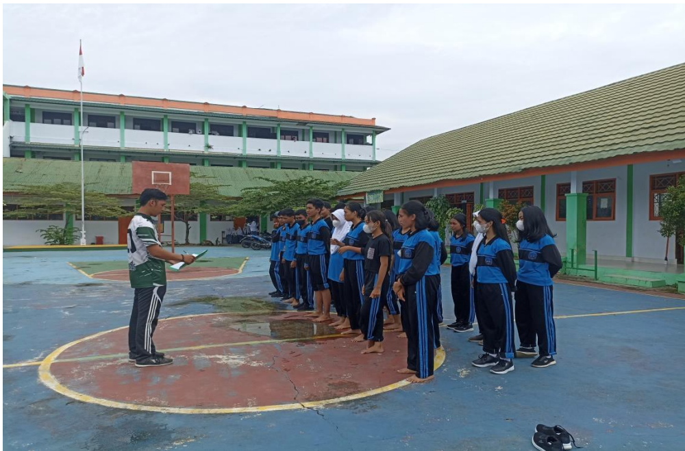
Gambar persiapan absensi sebelum olahraga