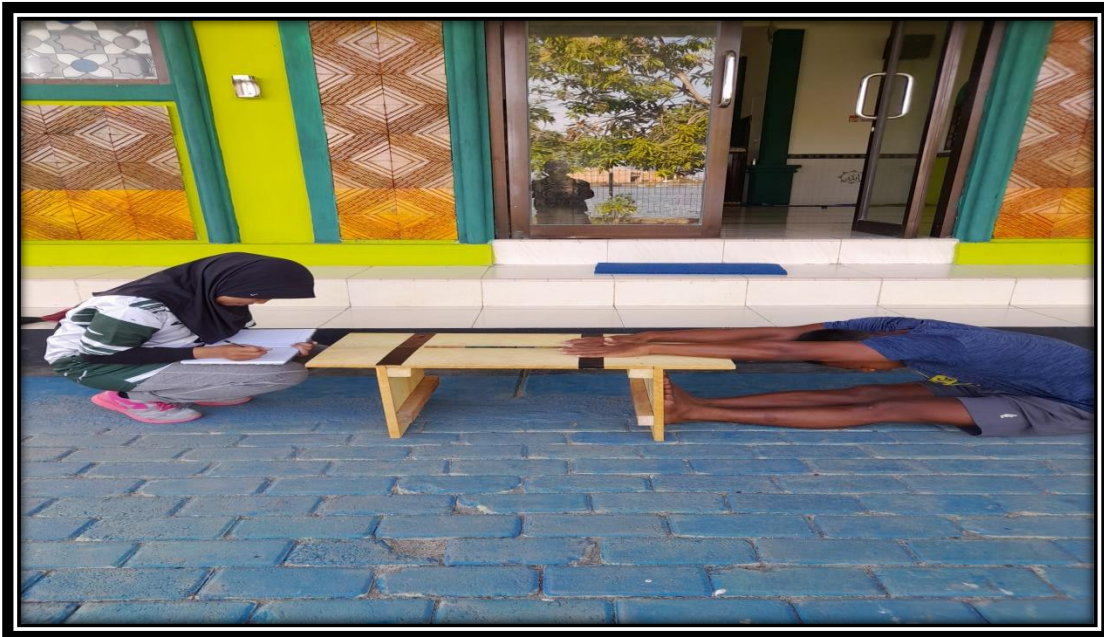
Tes Kelentukan Otot Pinggang menggunakan tes sit and rich