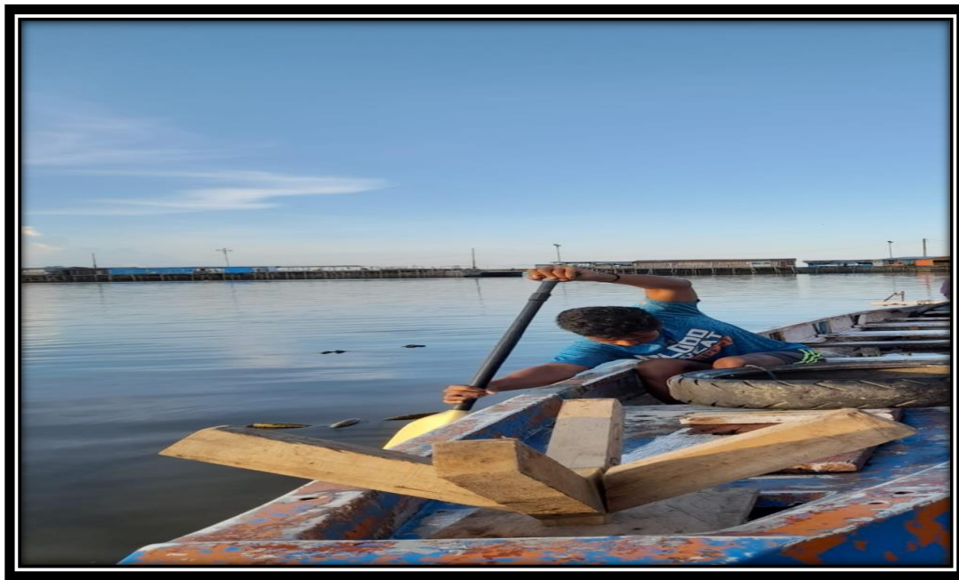
Tes Kecepatan Mendayung