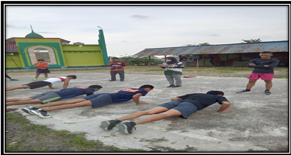
Tes Kekuatan Otot Lengan menggunakan tes push up