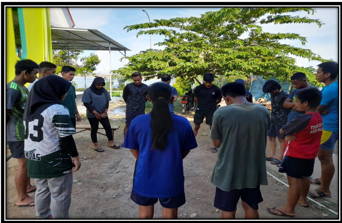
Berdoa dan Memberikan Pengarahan