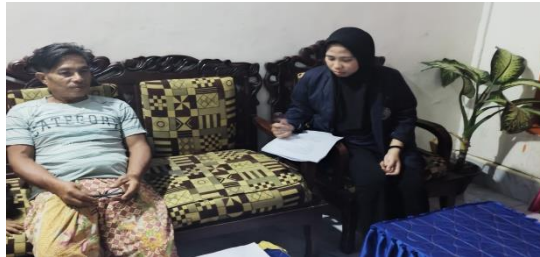
Gambar: Kepala Dusun