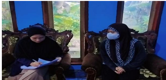
Gambar: Anggota Remaja Mesjid