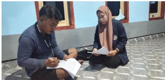
Gambar: Anggota Karang Taruna