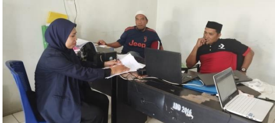
Gambar: Perangkat Desa