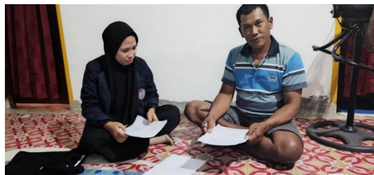
Gambar: Ketua RT