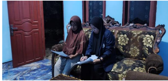
Gambar: Anggota PKK