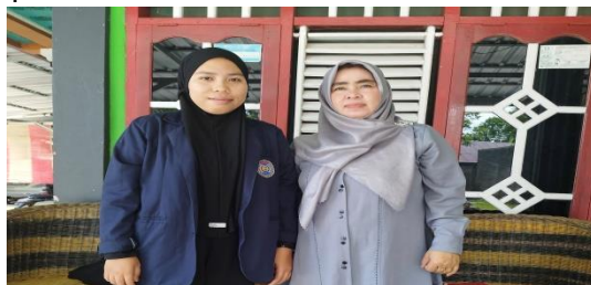
Gambar: Ketua PKK