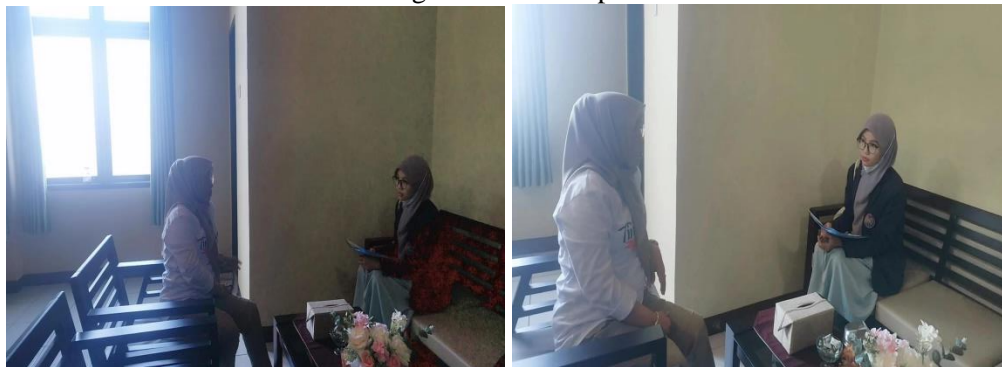
Wawancara Kasubang IT