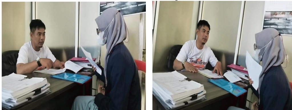
Memberikan kuesioner ke kasubang Umum untuk dibagikan ke seluruh Pegawai Bapenda