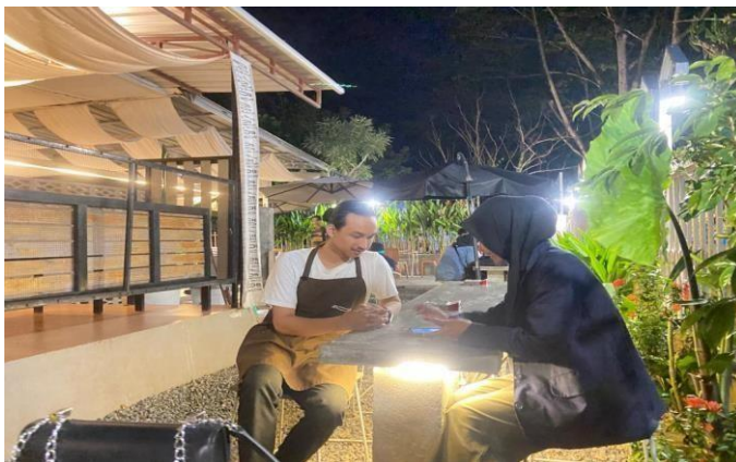
Gambar: Cafe Rabbit