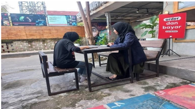
Gambar: Cafe Upstreet