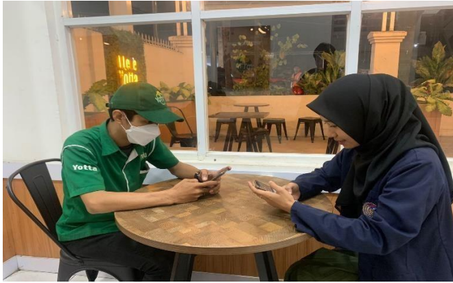
Gambar: Café Yotta