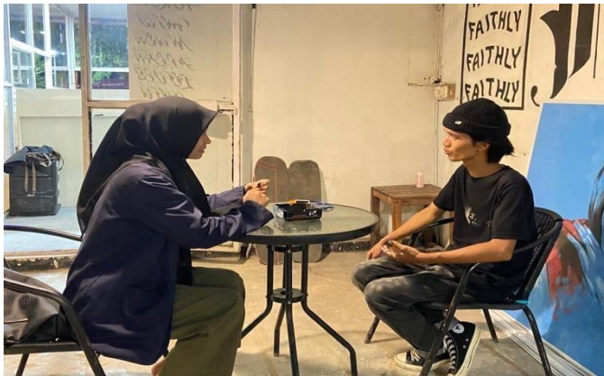
Gambar: Cafe Faithly