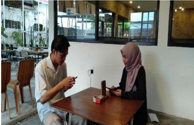
Gambar: Cafe Solata