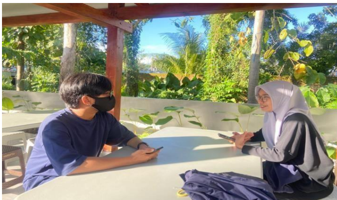
Gambar: Cafe Tuukeatery