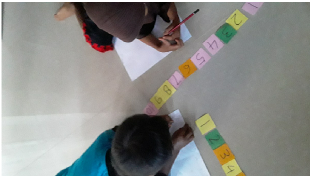
menulis angka 1-10