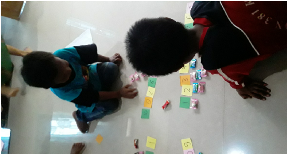
Kegiatan menghubungkan jumlah benda dengan angka