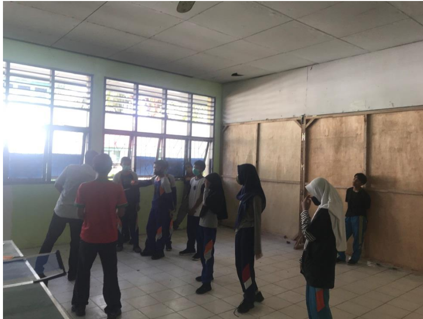
Penilaian sikap siswa (afektif)