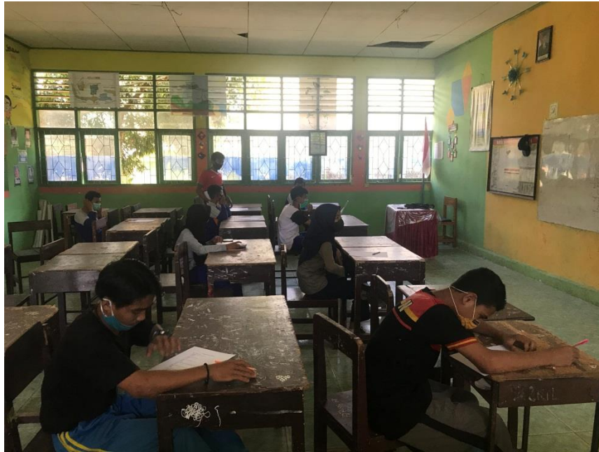
Tes siklus pengetahuan (kognitif)