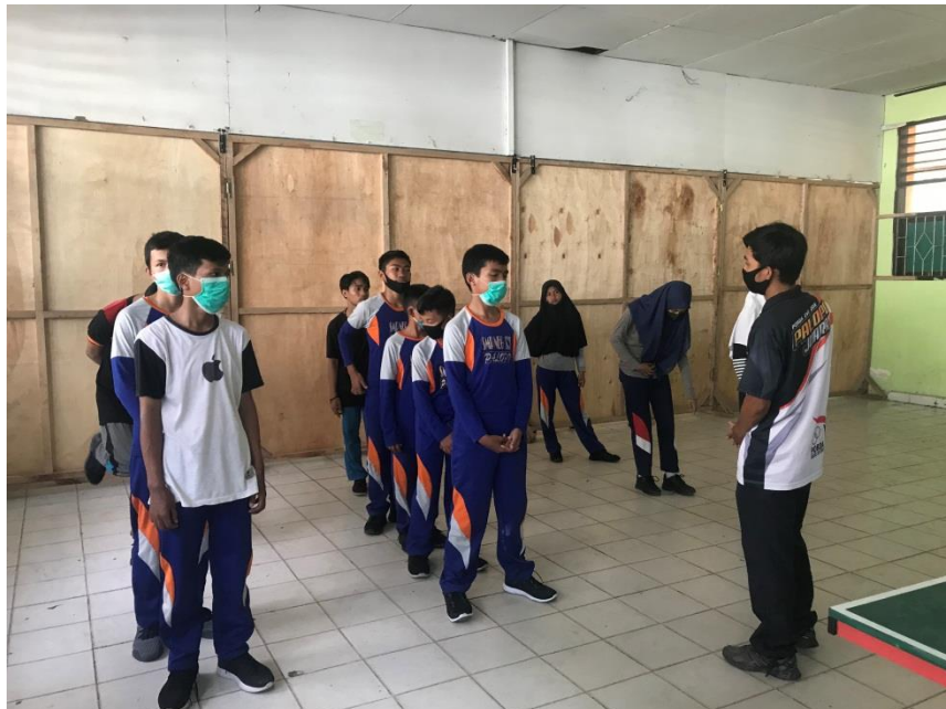
Memberikah sedikit masukan di akhir kegiatan