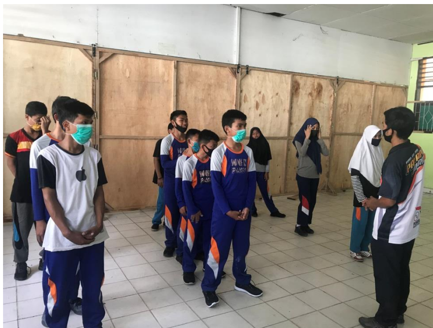
Menjelaskan materi tentang tenis meja