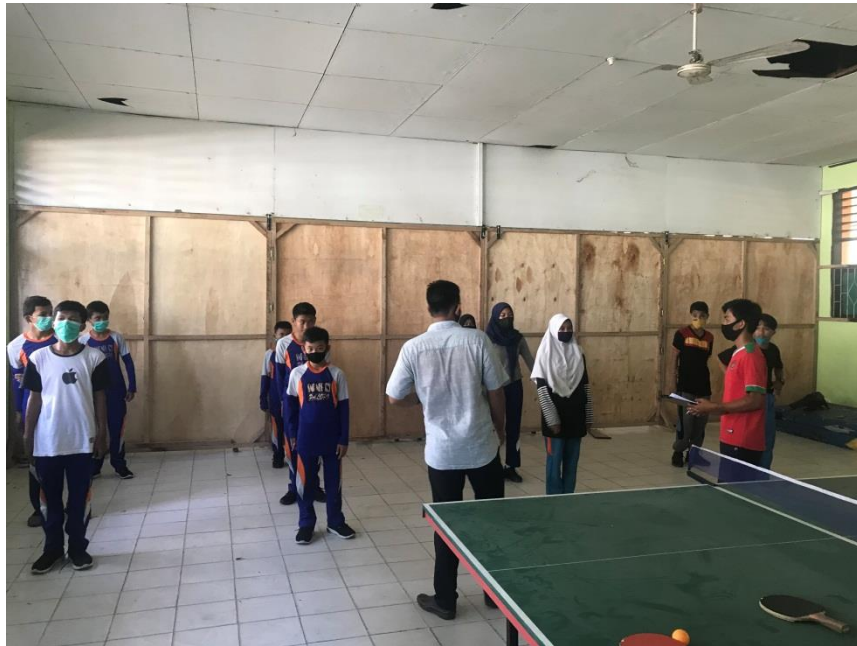
Memberikan sedikit arahan apa saja kendala yang terjadi pada siklus I SIKLUS II