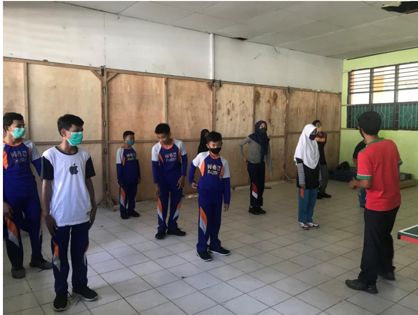
Berdoa sebelum kegiatan pembelajaran