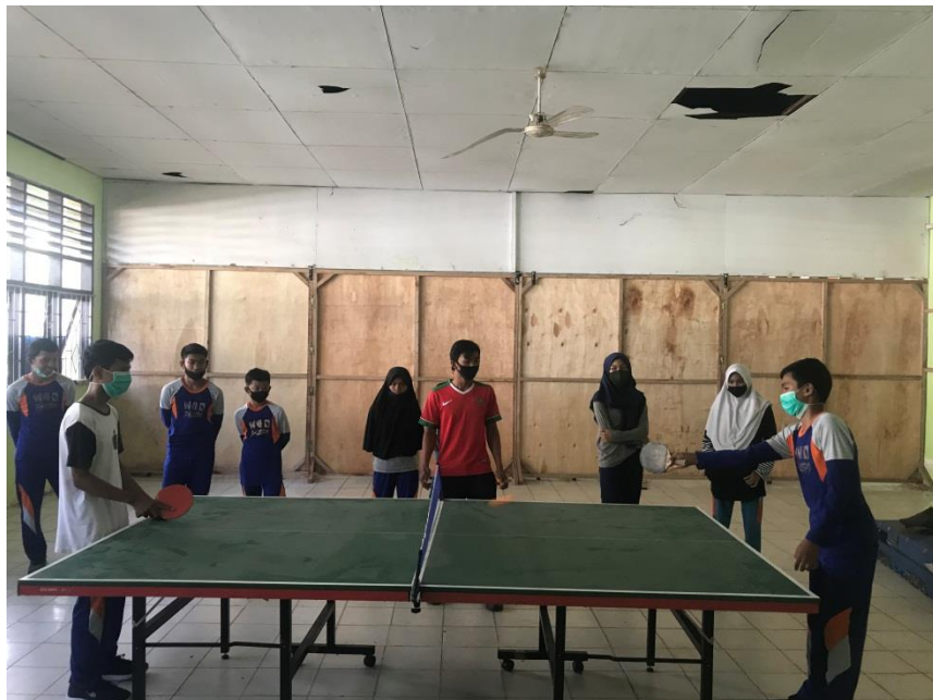
Tes siklus pada keterampilan (psikomotor)