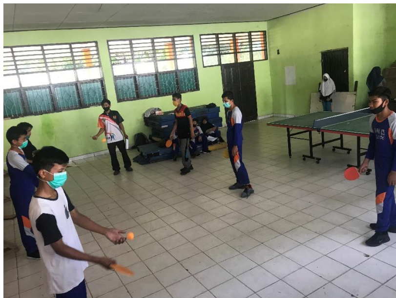
Penilaian sikap siswa (afektif)