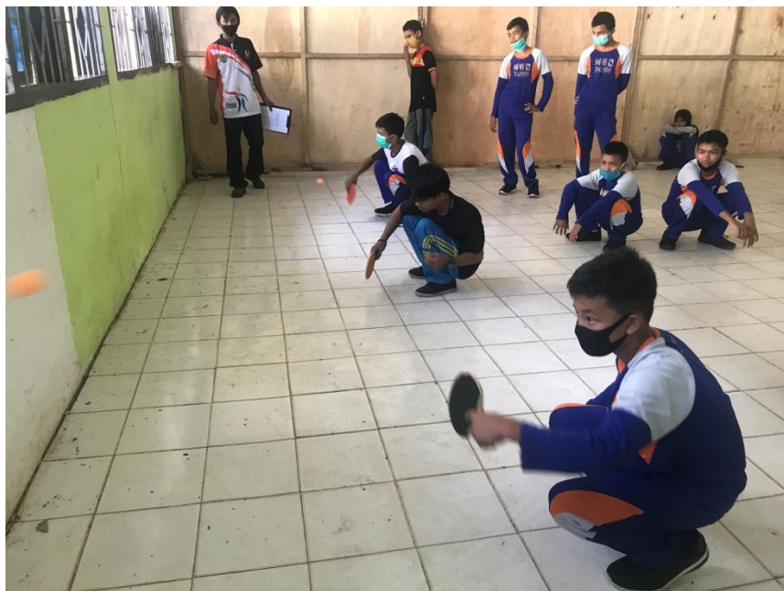
Latihan siswa bermain tenis meja dengan media dinding