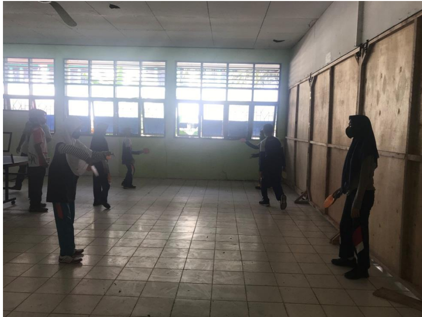
Melatih siswa dalam perkenaan bola ke pemukul secara berlawanan