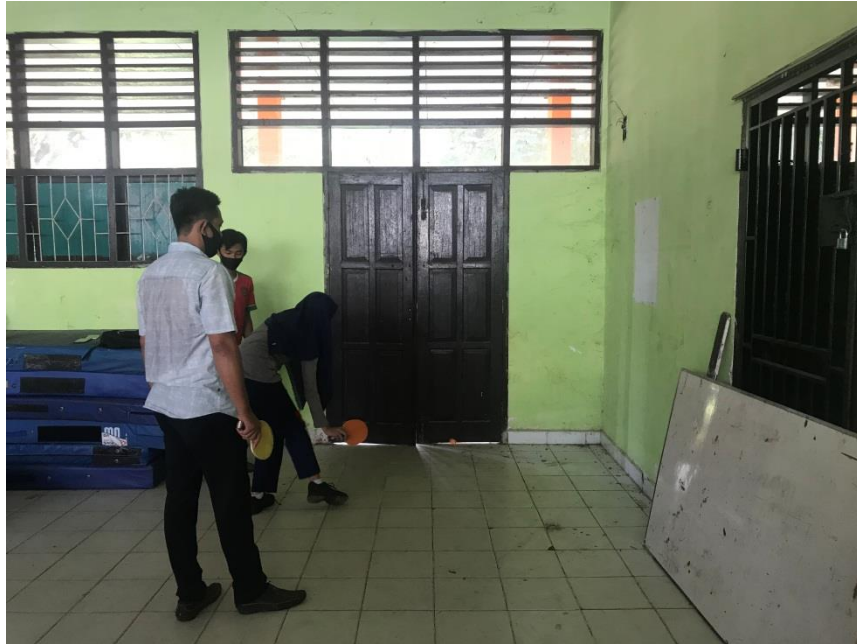
Latihan siswa bermain tenis meja dengan media dinding