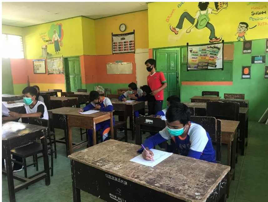
Tes siklus pengetahuan (kognitif)