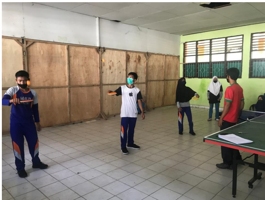
Latihan siswa meja keseimbangan bola