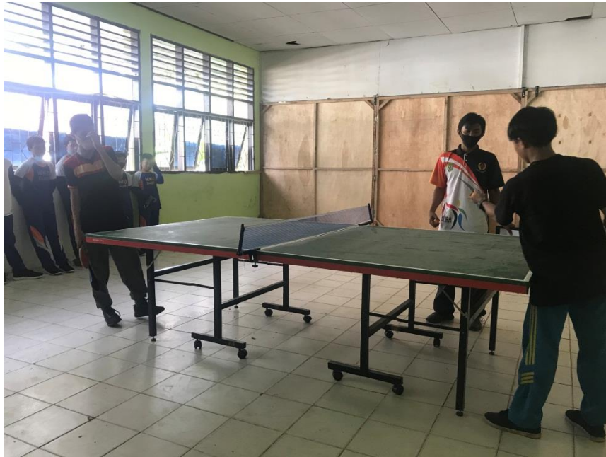
Tes siklus keterampilan (psikomotor)