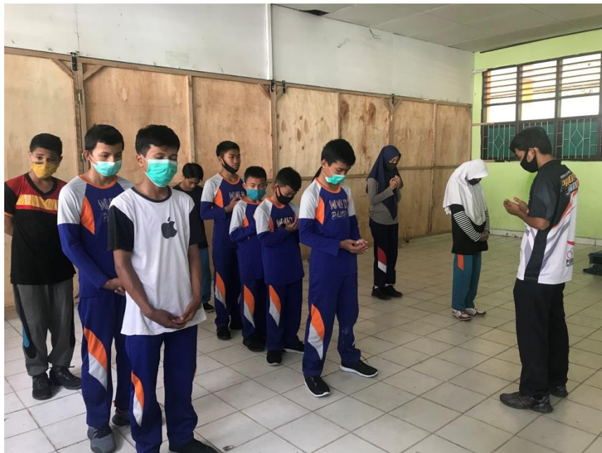
Berdoa sebelum dan sesudah kegiatan pembelajaran