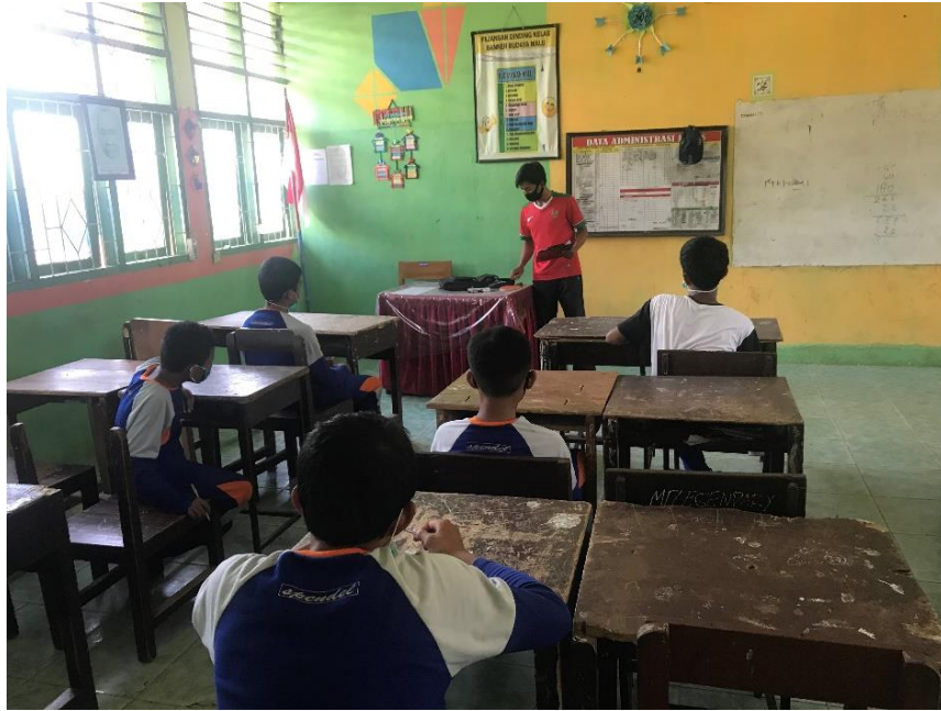
Pemberian materi tentang tenis meja